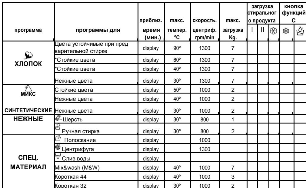
Таблица программ мод. EVOGT 13072D

** Программы стирки х/б в соответствие с (ЕС) n° 1015/2010 и n° 1061/2010