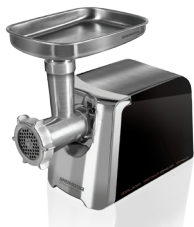
Мясорубка RMG-1205 RMG-1205-8