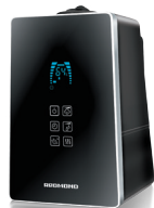
Увлажнитель воздуха RHF-3303