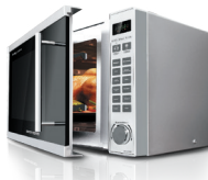
Микроволновая печь RM-M1007