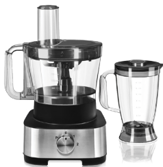
Кухонный комбайн RFP-3905