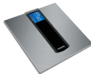
Весы напольные RS-723B