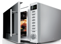
Микроволновая печь RM-M1006