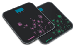
Весы напольные RS-715