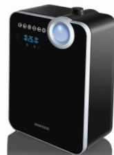
Увлажнитель воздуха RHF-3306