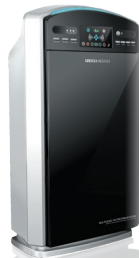
Очиститель воздуха RAC-3704