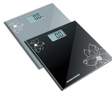
Весы напольные RS-708