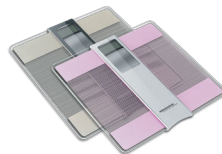
Весы напольные RS-719