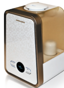
Увлажнитель воздуха RHF-3305