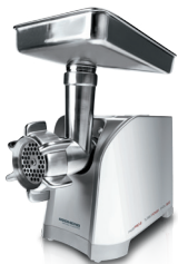
Мясорубка RMG-1203 RMG-1203-8