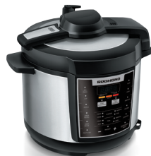
Мультиварка- скороварка RMC-M110