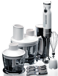
Кухонный комбайн RFP-3903