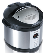
Мультиварка- сковарка RMC-M4504