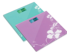
Весы напольные RS-707