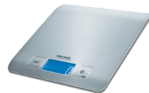
Весы кухонные RS-M720