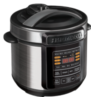
Мультиварка- сковарка RMC-PM190